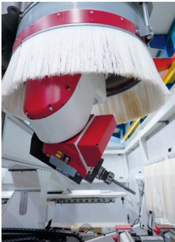
Optional integrierbar: die 5-Achs-Frässpindel erlaubt die flexible 3D-Bearbeitung und sämtliche Universalfräsarbeiten