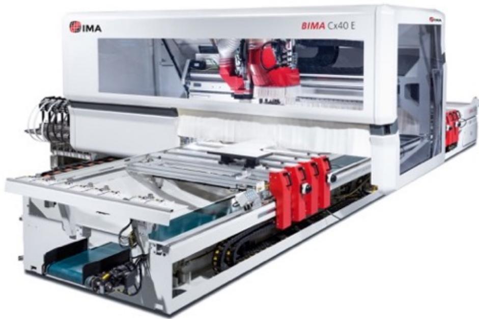
BIMA Concept Cx40 E: maximale Flexibilität bei der hochwertigen Bearbeitung von Holzwerkstücken unterschiedlichster Abmessungen