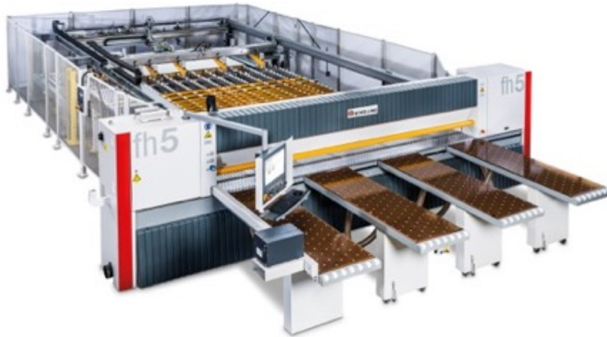
Schelling fh 5: vielseitige, präzise Plattenaufteilsäge für den flexiblen Zuschnitt von Einzelplatten und Paketen